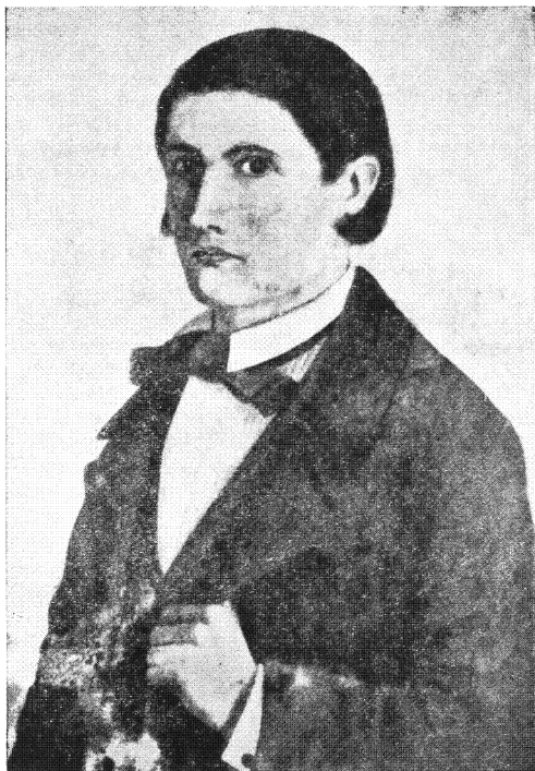
Autorretrato de Cándido López, pintado a los 18 años, antes de perder su brazo derecho.