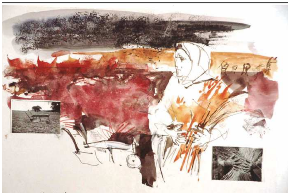
06. «La nona María, la primera cosecha, las langostas». Gouache de Juan Carlos Castagnino para el guión de Mal d'America de Birri-Pratolini (1965)