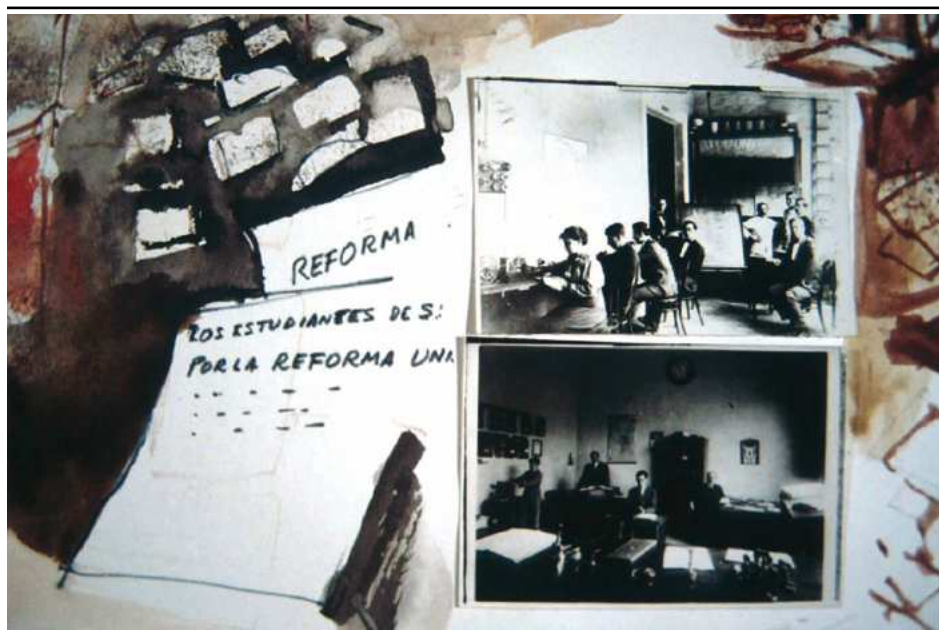
05. «La UNL. Reforma universitaria del '18». Gouache de Juan Carlos Castagnino para el guión de Mal d'America de Birri-Pratolini (1965) (gentileza F. Birri)