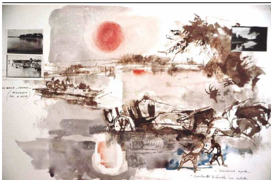
08. «El cruce del Salado». Gouache de Juan Carlos Castagnino para el guión de Mal d'America de Birri-Pratolini (1965)