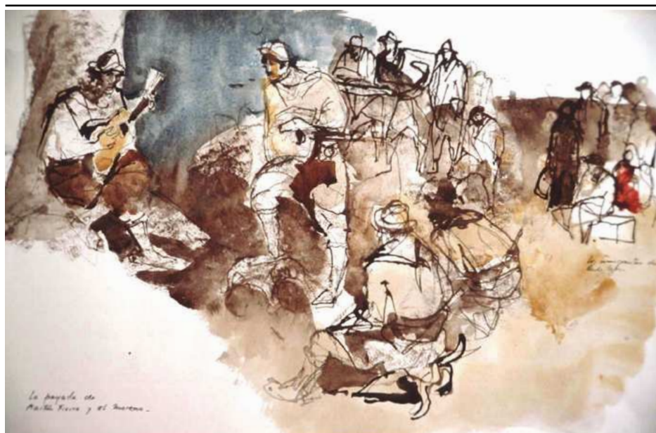
07. «Payada de Martín Fierro con el Negro, los inmigrantes llegan». Gouache de Juan Carlos Castagnino para el guión de Mal d'America de Birri-Pratolini (1965)