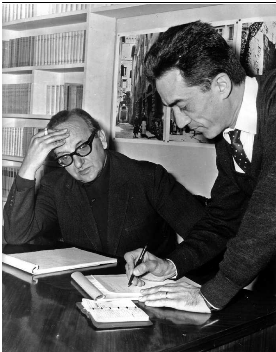
04. Fernando Birri y Vasco Pratolini. 1965, Roma.