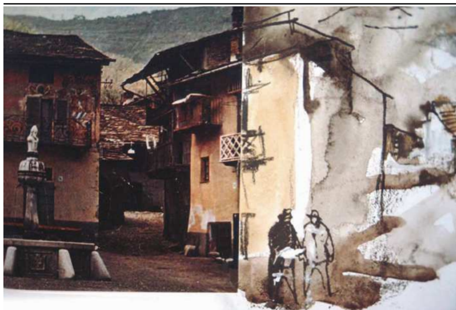
09. «San Lupo, los anarquistas utópicos». Gouache de Juan Carlos Castagnino para el guión de Mal d'America de Birri-Pratolini (1965)