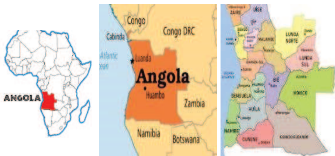
Figura 1: Ubicación de la Provincia de Bié

Cuito está situado en la región centro del sur de la provincia de Bié y es su capital. Su área territorial es de 4.814 km 2 . Está delimitado a Norte por el Municipio del Cunhinga, al Sur por el Municipio del Chitembo, al Este - Catabola y Camacupa; a Oeste - Chinguar. Dista a unos 709 km de Luanda (Capital de Angola) y a 150 km de Huambo (Capital de la Provincia de Huambo). El Municipio de Cuito forma parte de la conexión con la Provincia de Benguela (Angola), la República de Namibia la República de Zambia y las Repúblicas de los Congos (Figura 1).