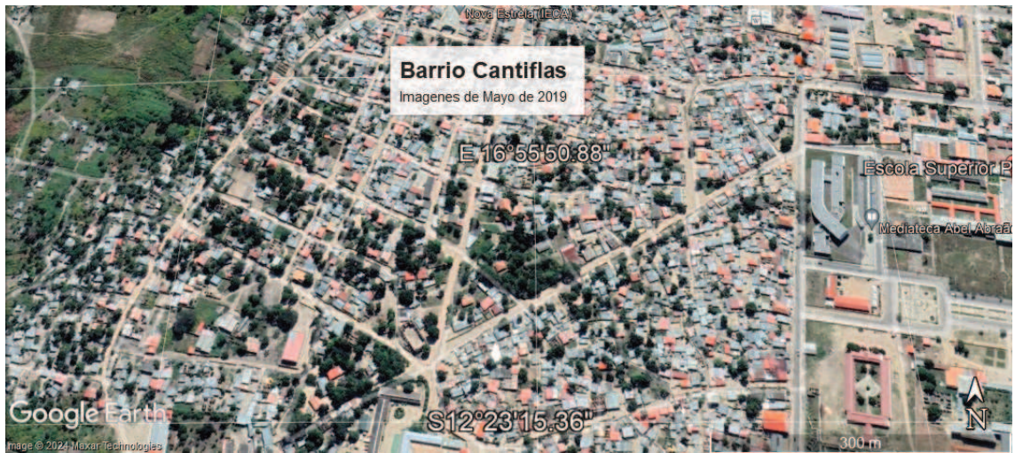
Figura 9: imágenes satelitales del crecimiento y ocupación del barrio