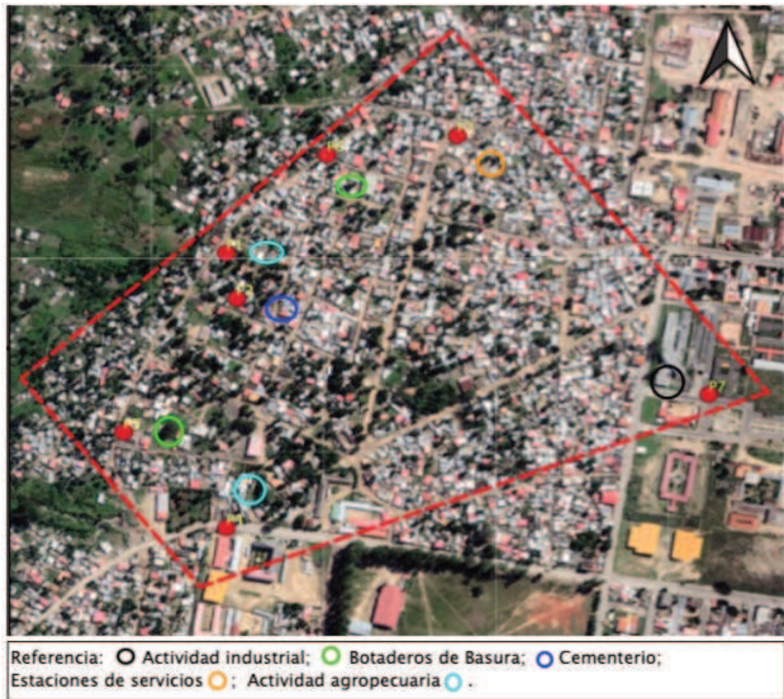
Figura 4: Principales actividades potencialmente contaminantes identificadas en el Barrio, Fuente: Adaptado de Google Earth, 2022.

Las Figuras 4 a 11 presentan las imágenes obtenidas de Google Earth para los años 2002, 2010, 2014, 2017, 2019, 2022, 2023 y 2024. En estas fechas es posible observar la evolución, ocupación y el crecimiento desordenado del Barrio Cantinflas sin cumplir con el ordenamiento territorial y un plan director.