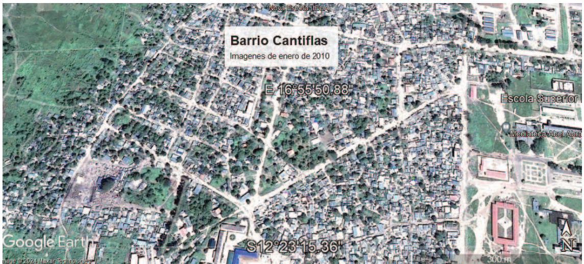
Figura 6: imagens satelitais del crecimiento y ocupación del barrio, Fuente: Google Earth, 2010