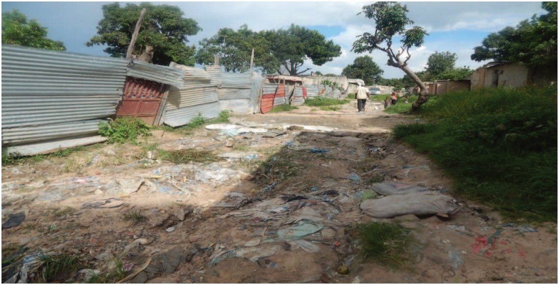
Fotografía 14: Calles del Barrio