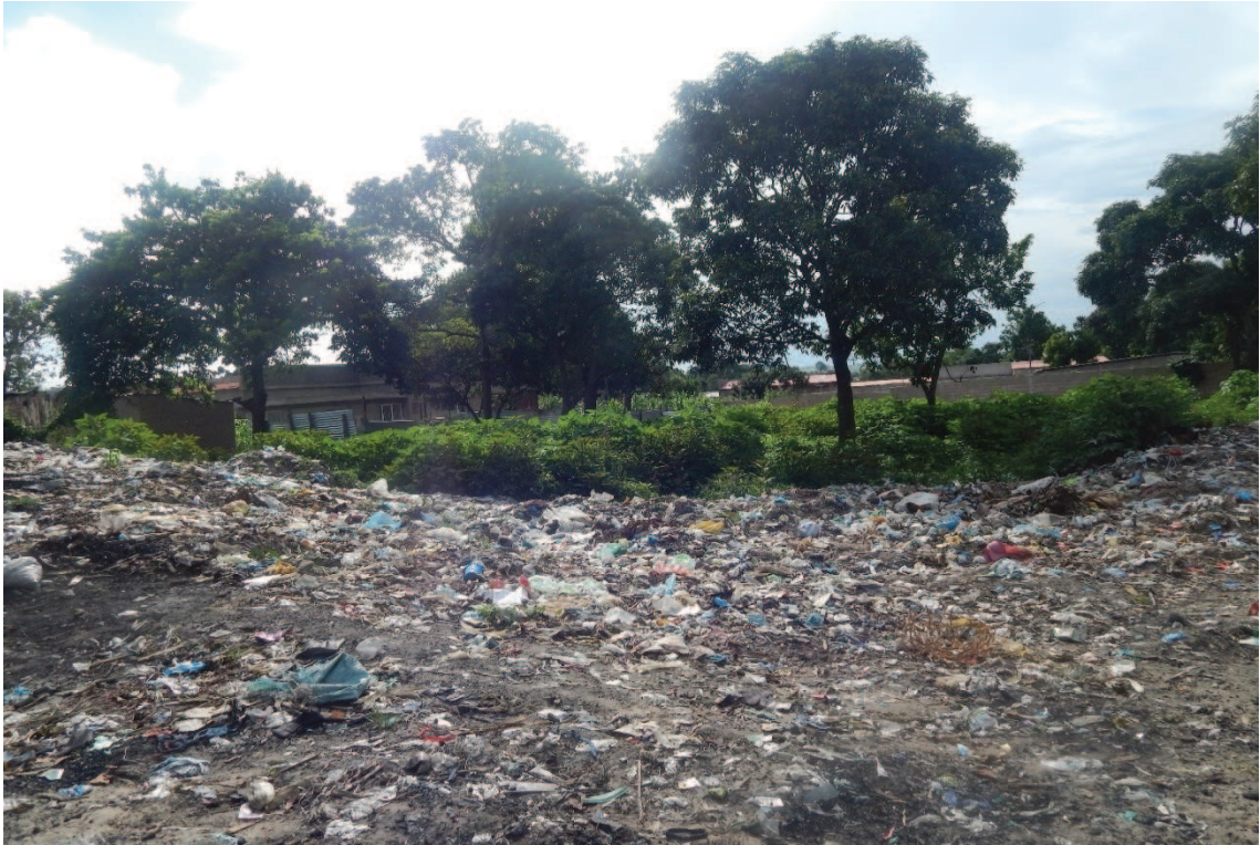
Fotografía 16: Calles del Barrio