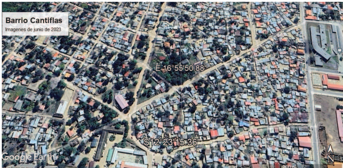
Figura 11: imágenes satelitales del crecimiento y ocupación del barrio