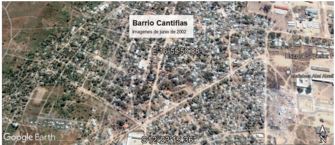
Figura 5: imagens satelitais del crecimiento y ocupación del barrio, Fuente: Google Earth, 2002