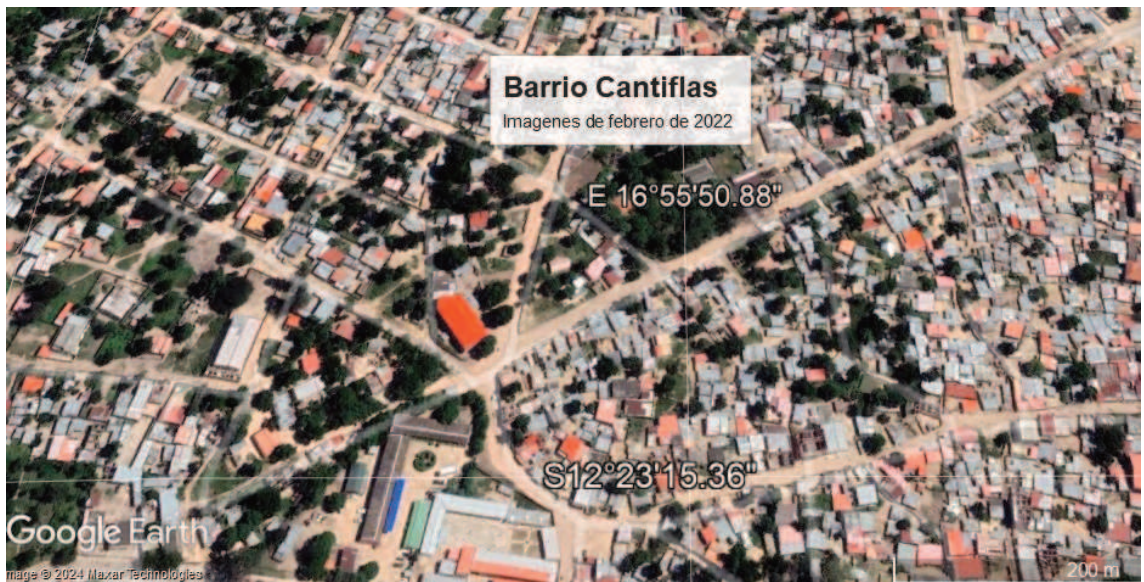
Figura 10: imágenes satelitales del crecimiento y ocupación del barrio, Fuente: Google Earth, 2022