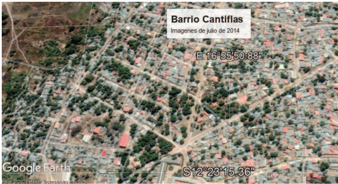
Figura 7: imágenes satelitales del crecimiento y ocupación del barrio