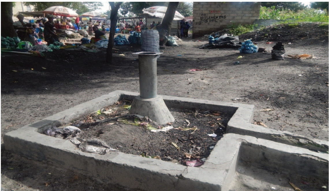
Fotografía 15: Calles del Barrio