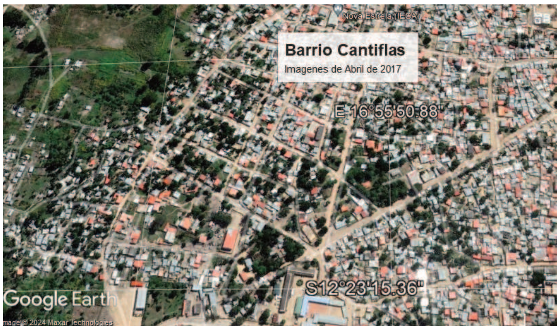
Figura 8: imágenes satelitales del crecimiento y ocupación del barrio