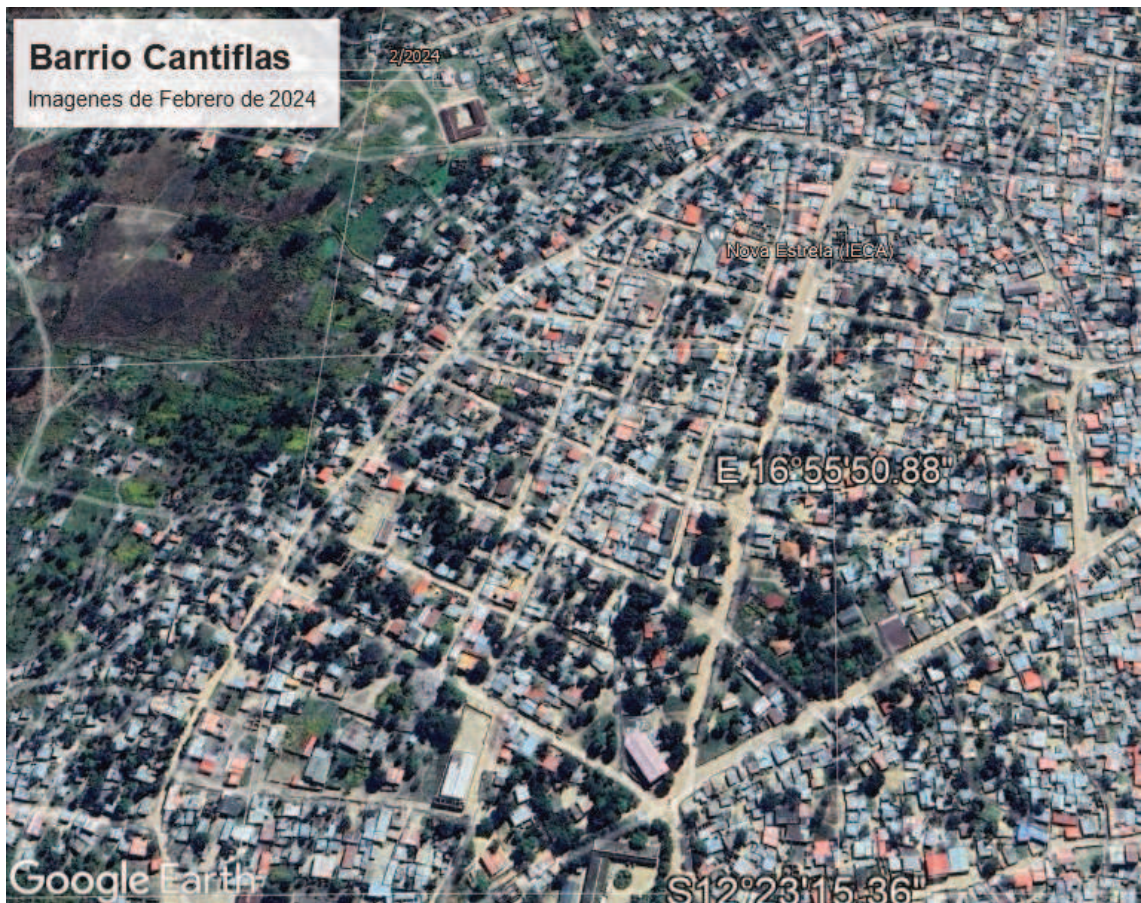
Figura 12: imágenes satelitales del crecimiento y ocupación del barrio, Fuente: Google Earth, 2024.