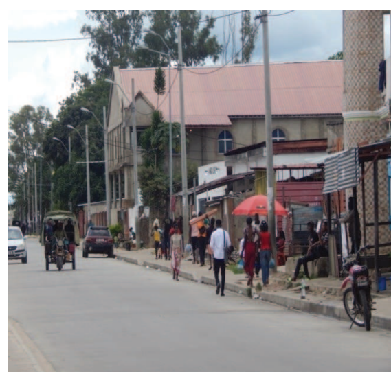
Fotografías 1 a 6: Calles del Barrio.