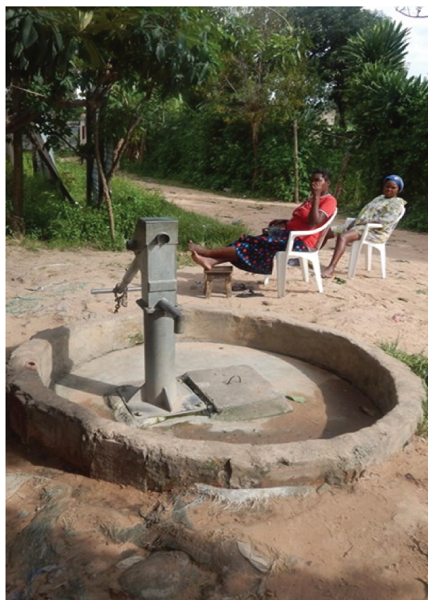
Fotografías 10, 11, 12 y 13: Pozos públicos, con hormigón, bomba, manilla y una base.