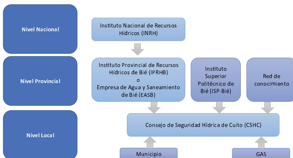
Figura 12: Esquema de Gobernanza propuesto para el sistema de abastecimiento de agua potable de Cuito.