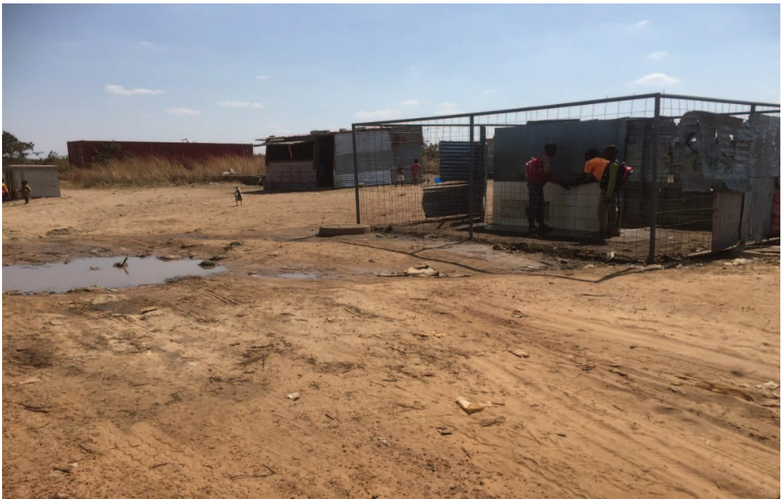
Fotografía 17: Calles del Barrio